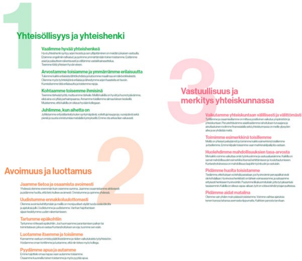
Kuva 2. Kulttuurin kulmakivet